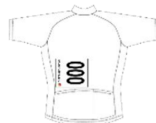
子どもと大人のバディリレー、エンデューロ取付位置(右側) クリテリウム取付位置(左側)