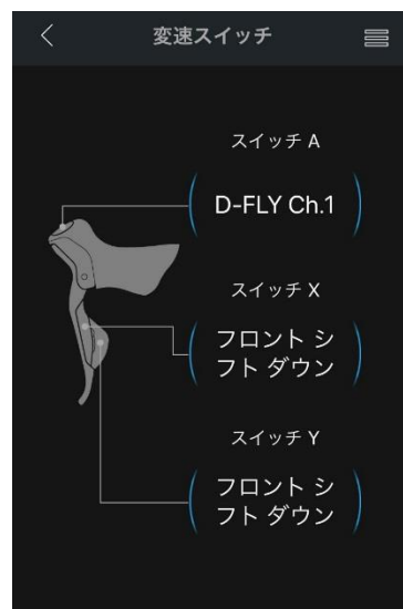
○インナー固定の変速スイッチ設定